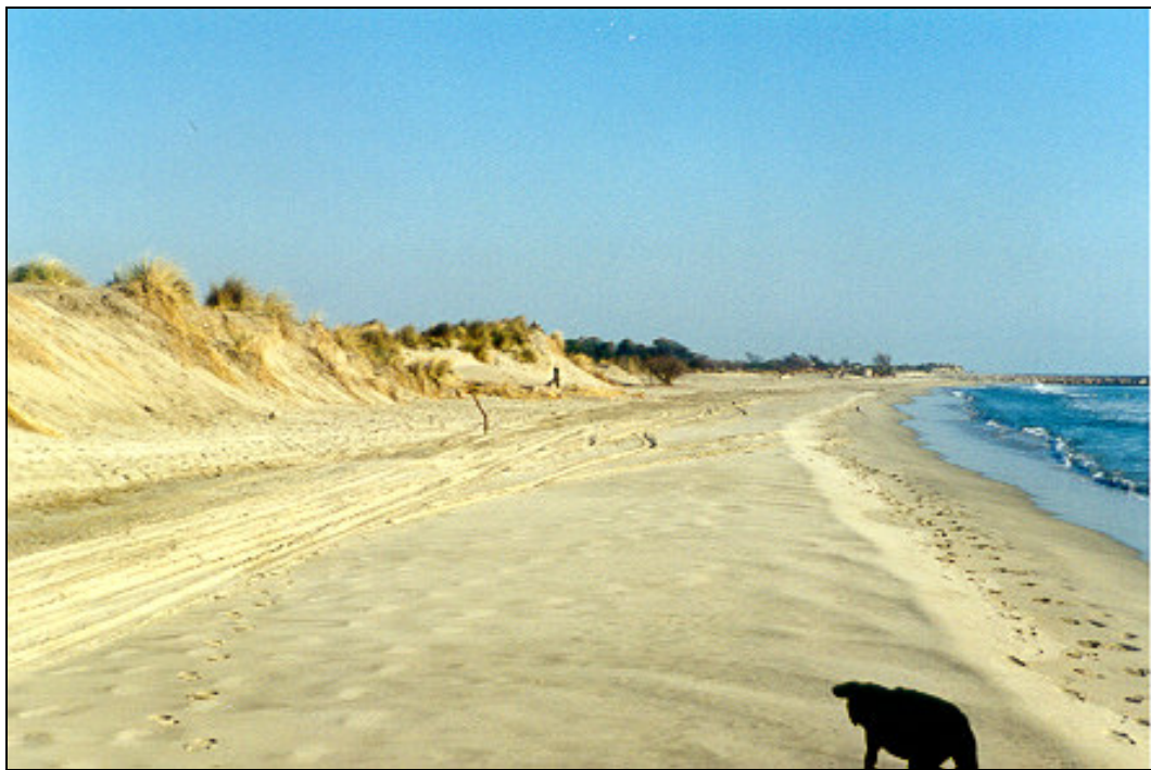
Figure 4.3 : Plage et dune de l'Espiguette dans le Gard

Il ne peut y avoir de dune pérenne que si l'avant-plage fonctionne avec un bilan net de transport du large vers la terre et si le vent ne peut pas remporté immédiatement le sable qu'il vient d'apporter. La présence d'obstacles, naturels ou artificiels, à la surface du sable est donc un élément essentiel de la permanence de la dune.