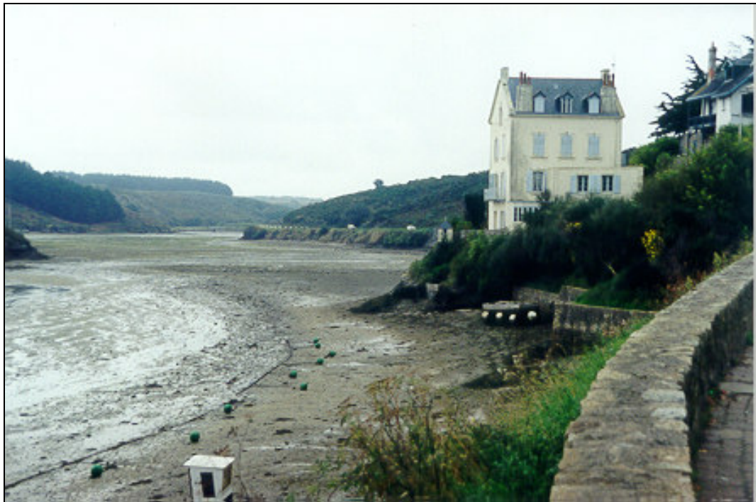
Figure 5.1 : Vasière littorale dans l'anse de Sauzon (Photo J. Bougis).

La différence de régime de consolidation des sédiments entre les parties subtidale et intertidale de la vasière, se traduit par une plus forte accrétion sur l'estran que sur l'avant-côte. Il en résulte une discontinuité de pente qui, contrairement aux plages sableuses, est plus importante sur l'avant-côte que sur l'estran.