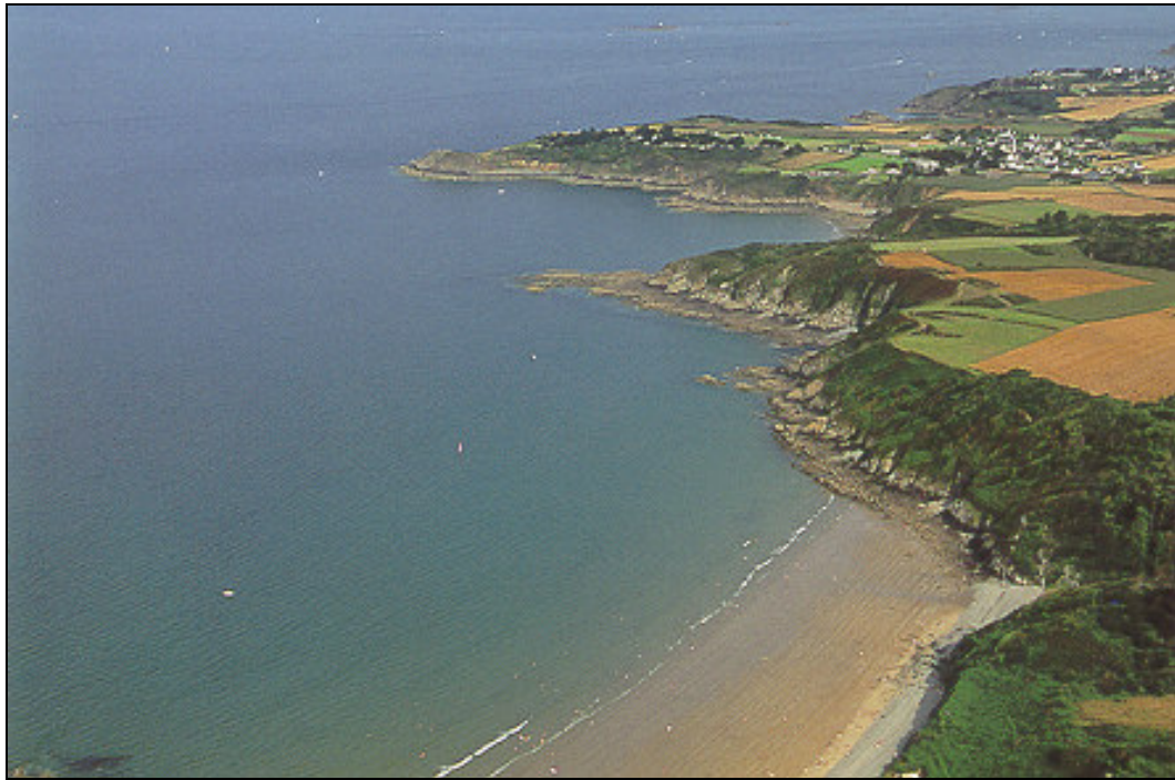
Figure 3.2 : Les fausses falaises de Pors-Even dans les Côtes d'Armor.

La dénudation est la révélation du crypto-relief qui existait en profondeur entre la roche saine et les altérites aujourd'hui emportées, ou parfois à la limite d'une roche autrefois façonnée par la mer ou par les intempéries puis ensevelie sous un manteau sédimentaire. Ces crypto-reliefs sont très variés selon leur origine (granites altérés du tertiaire, roches carbonatées, coulées de solifluxion, limons éoliens ...)