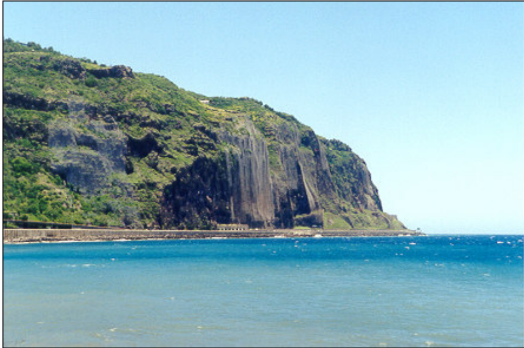
Figure 3.7 : Les falaises de la route littorale à Saint-Denis de la Réunion. Les filets de protection permettent d'assurer "à-peu-près" la sécurité de la circulation.

Il est bien sûr possible d'essayer de déplacer vers la mer le profil d'équilibre en construisant le mur d'arrêt sur le bas estran relativement loin du pied de la falaise. Cela sera encore plus efficace si le projet est accompagné d'épis empêchant l'enlèvement des débris par la mer. Cette seconde action risque toutefois d'avoir des conséquences importantes et néfastes sur le transport littoral.