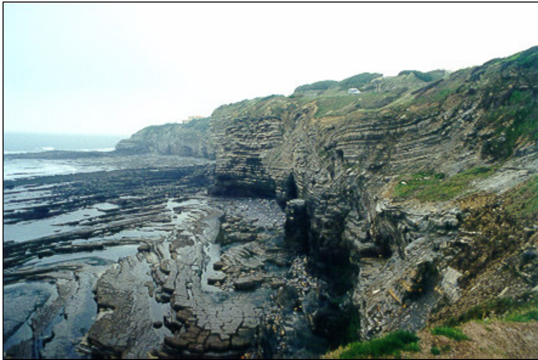
Figure 3.4 : La falaise de Saint-Jean-de-Luz dans les Pyrénées Atlantiques.

Les falaises sans plate-forme d'abrasion apparente sont des falaises héritées d'une époque où le niveau marin était plus bas, et la plate-forme d'abrasion existe, à l'état de relique inactive ou submergée. C'est le cas des Calanques de Cassis où la plate-forme d'abrasion qui a contribué à la formation de la falaise, il y a plus de dix mille ans, est maintenant immergée à -40 mètres. Aujourd'hui, la falaise n'est plus fonctionnelle.