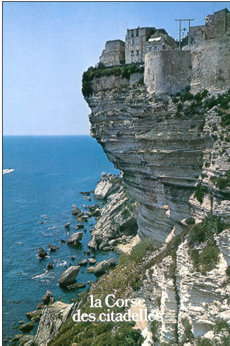
Figure 3.8 : Les falaises de Bonifacio en Corse tiennent en surplomb parce qu'elles sont sèches.

au maximum la charge en eau du sous-sol dans lequel est taillé la falaise. Il ne faut injecter dans le sol que le minimum possible d'eau et donc bannir les puisards, permettre l'évacuation vers l'arrière des eaux stagnantes et des eaux de ruissellement, drainer les eaux intérieures de la falaise pour qu'elles s'évacuent sur les côtés. Il est plus difficile de lutter contre d'autres facteurs d'intempéries comme le vent et le gel.