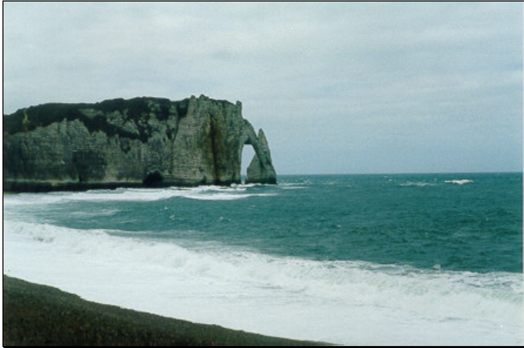
Figure 3.5 : Les falaises d'Etretat dans la Seine Maritime.

Les éléments résistants des roches ne sont pas nécessairement homogènes. Il arrive que l'existence de réseaux de diaclases verticales croisées engendre des paysages déchiquetés (figure 3.6).