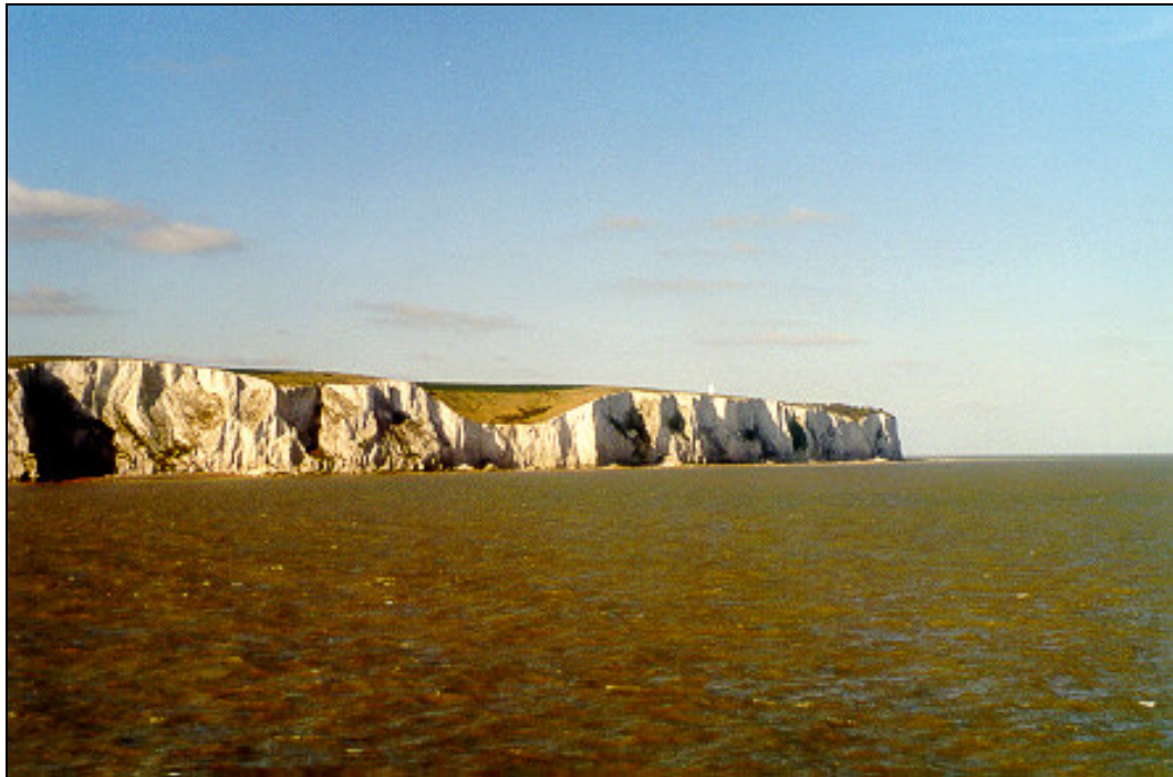
Figure 3.3 : Les falaises de Douvres en Angleterre.

Son originalité provient de ce que les matériaux entraînés vers sa base sont déblayés au fur et à mesure, ce qui interdit au versant de prendre son profil d'équilibre, et renouvelle sans cesse son attaque subaérienne.