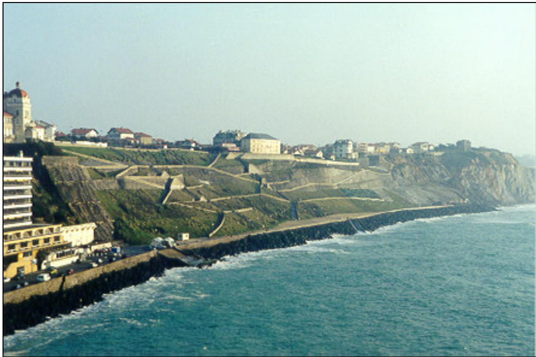
Figure 3.9 : Les falaises tuées d'Iibaritz et Bidard dans les Pyrénées Atlantiques.

Comme exemple réussi d'aménagement de côtes à falaises, on peut citer les falaises d'Iibaritz et de Bidard dans les Pyrénées Atlantiques. Elles ont été tuées avec une pente à environ 45°. Le recul du haut de la falaise est de l'ordre de la hauteur de la falaise (figure 3.9).