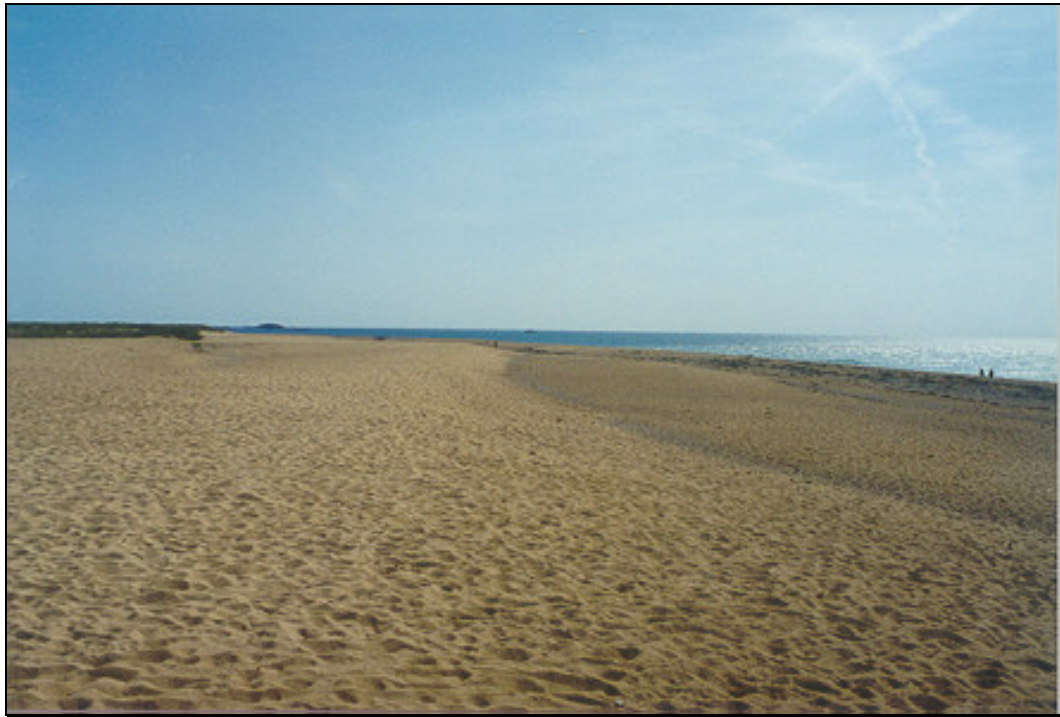
Figure 4.2 : Profil d'une plage exposée aux houles dominantes d'Ouest à Etel dans le Morbihan

Le profil d'une plage est l'assemblage d'une suite de pentes, dont chacune correspond à une dimension des sédiments. Dans un profil cohérent, le profil est concave vers le haut.