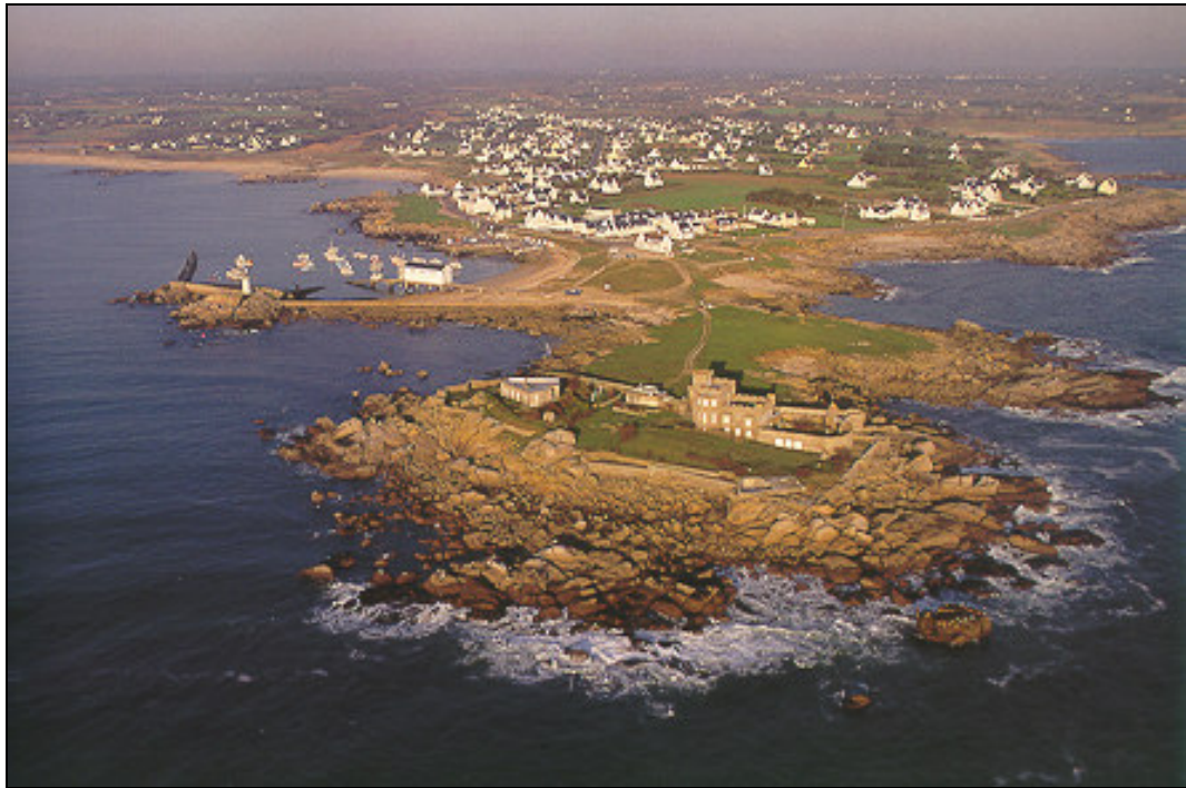
Figure 3.1 : La pointe de Trévignon à Trégunc, sur la côte sud du Finistère. Paysage littoral à dénudation typique.

de la roche sans détruire toutes les traces de la végétation terrestre. Plus bas, la végétation et les lichen disparaissent progressivement jusqu'au platier rocheux que la mer couvre à chaque marée (figure 3.1).