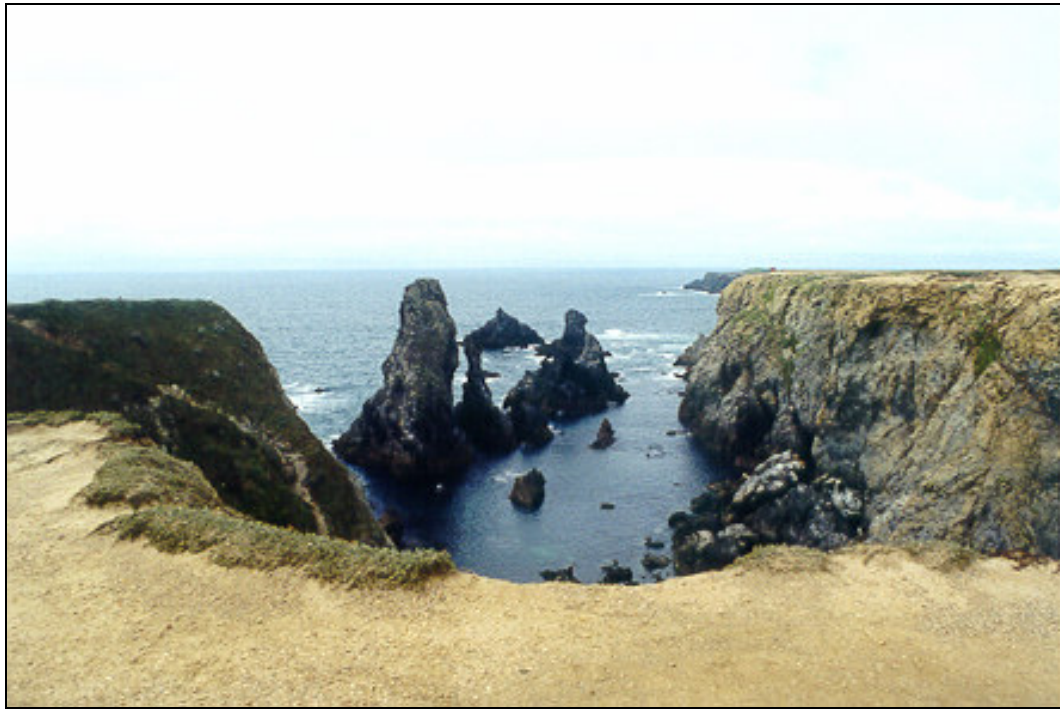
Figure 3.6 : Les Aiguilles de Port Coton à Belle-Ile-en-Mer dans le Morbihan.

Dans la pratique, l'aménagement d'un littoral à falaise doit se faire en tranchant le dilemme suivant :