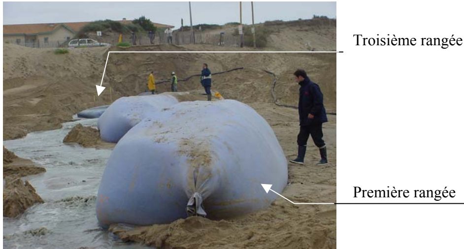
Figure 3: Tubes en cours de remplissage. Première rangée sur la droite. Remplissage de la troisième rangée (à gauche).

Les tubes mis en œuvre sur la plage de l'Amélie ont une longueur standard de 38 m. La rangée la plus proche de la mer est enterrée d'environ 1 m pour limiter l'affouillement devant les tubes. La période de réalisation coïncidait avec la période de grandes marées aussi avons-nous perdu très rapidement 0.50 m de sable devant nos tubes les laissant ainsi émergés d'environ 1 m.