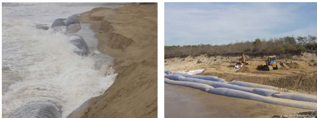
Figure 4: Brise-lames en tubes de la plage nord pendant (à gauche) et après (à droite) la deuxième tempête.